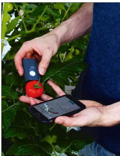
Ziel des Projektes ist die Bewertung des Food-Scanner-Einsatzes von der Produktion bis in den Handel.