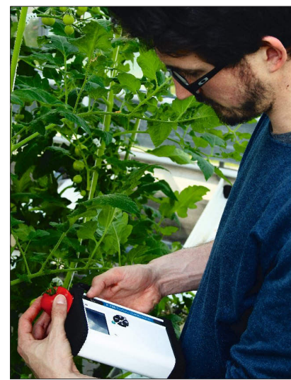
Einsatz des F-750 im Pflanzenbestand.