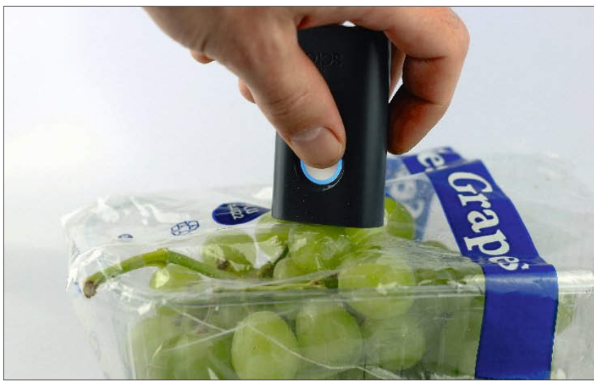
Auch durch Verpackungsfolie hindurch ist eine sehr hohen Genauigkeit möglich.

Für die Erstellung von Vorhersagemodellen müssen die Fruchtspektren aufgenommen und entsprechende Referenz-